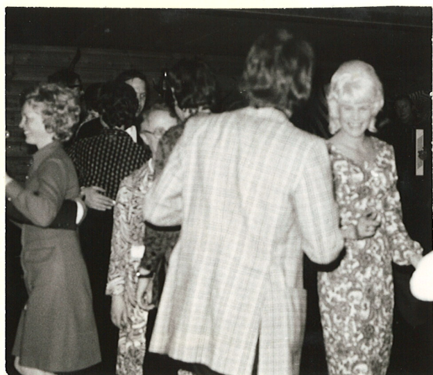
ÄVEN PÅ DANSGOLVET KAN DET BLI TWIST