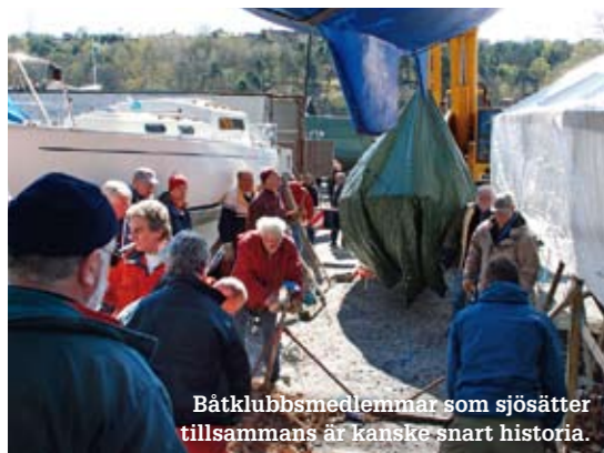
Båtklubsmedlemmar som sjösätter tillsammans är kanske snart historia.