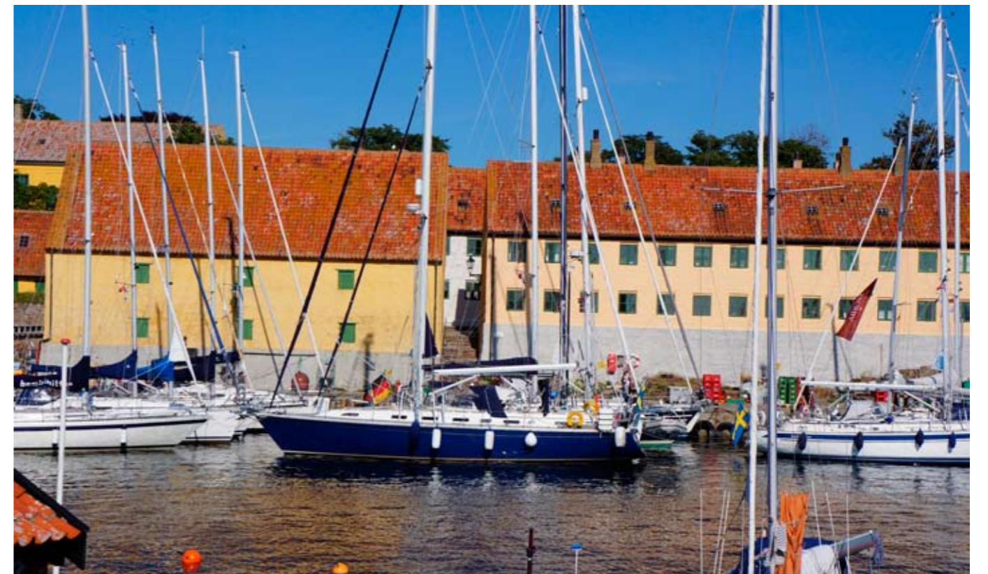
Hamnen vid Christians Ö.