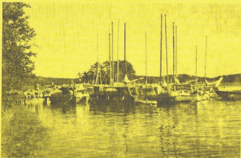
Klubbholmen efter hösttävlingen.