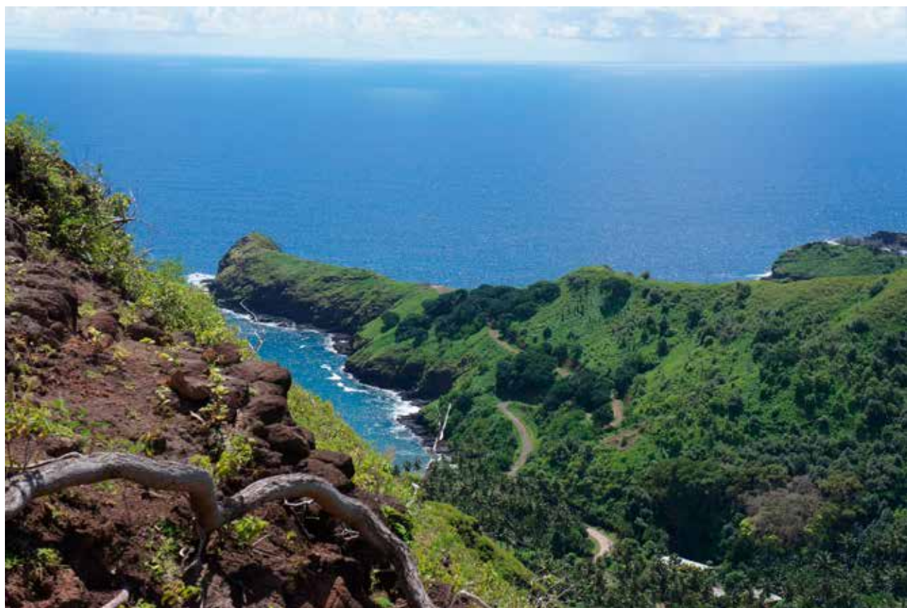
HIVA OA – HÖGA BERG OCH DJUPA DALAR, HISSNADE VÄGAR LÄNGS KANTERNA, OTROLIGT VACKERT!