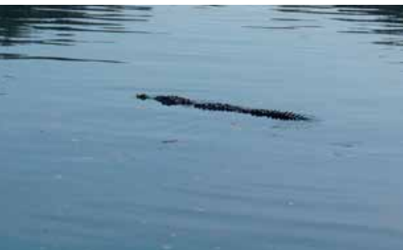
NÄR VI HADE BADAT FÄRDIGT, KOM DENNA KROKODIL FÖRBI.

Väl uti stilla havet ankrade vi i viken La Plaita . Det är guppigt, av all trafik. Men det enda alternativet om du inte väljer att gå in i en marina som kostar 3,50 dollar per fot och natt. "Så Sandhamn är rätt billigt fortfarande." För att få lägga till med jollen betalar du en veckoavgift på 65 dollar, bara att hosta upp och se glad ut. Vi besökte karnevalen och tittade på gamla stan i