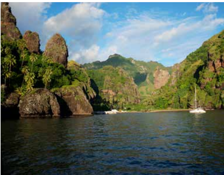
FAKU HIVA, FÖRSTA ÖN VI KOM TILL EFTER 29 DAGAR MED BARA VATTEN.

När vi legat i Faku Hiva ett par dygn åkte vi över till grannön Hiva Oa för att checka in hos polisen. Vi som är Européer behöver inget visa och du betalar bara för ett