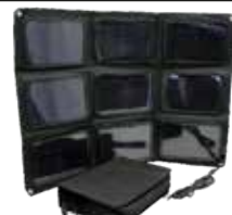
Flexibel solpanel 50W

Frontbeläggningen är resistent mot saltvatten och UV-strålar. Max spänning: 17,6V. Max laddström 2,85A Mått utvikt: 975x670mm