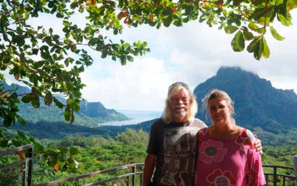
MOOREA UTSIKT ÖVER COOKS BAY.

i lagunen, det gäller att ha koll på tidvattnet.