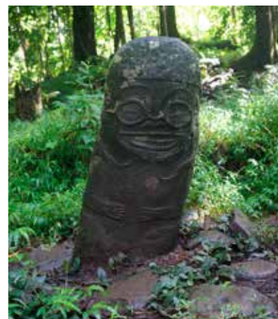
TIKIS PÅ HIVA OA, HÄR DERAS GAMLA GUDABILDER INNAN MISSIONÄRERNA KOM.

OCH SÅ FANNS DET MASSOR AV ROCKOR, DE GILLAR NÄR MAN KLAPPAR DEM.