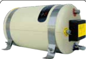
Varmvattenberedare 22l RF

Quick TerminoX i rf stål med termostat-blandare . Isolering av polyuretan med hög densitet. Elpatron 800W med extra stor vta.