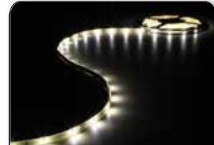
LED stringlight 5m 150LED

Varmvit med 3M tejp för säker montering. Kan kapas var tionde centimeter. 150st LED med en ljusvinkel på 140 grader, coated med epoxy. IP61