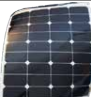
Sunbeam Classic 50W

Tunn högeffektiv solpanel som kan böjas. Vikt: 0,9kg Mått: 53,5x62,2cm Max spänning: 21,2V Max ström: 2,84A