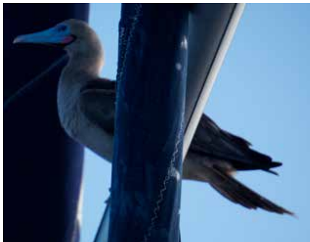
EN SULA, ELLER EN BOOBY BOSATTE SIG HOS OSS ETT PAR DAGAR.

Cook och hans gäng upptäcktsresande/kolonisatörer tillsammans med missionärerna lyckades utrota 90% av befolkningen på 50 år med hjälp av sjukdomar, sprit och vapen.