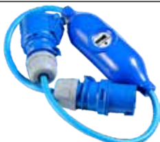
Elmätare portabel 16A

GARMIN LOWRANCE Raymarine SIMRAD MASTERVOLT SERVICE PARTS NASA advanSea ICOM redKnows