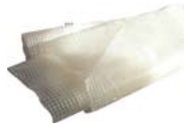
Microflex press 250gr

Bästsäljaren av alla pressar, transparent med grov glasfiberförstärkning, standard öljetter. 4x6, 5,4x7,2, 6x10, 7,2x12