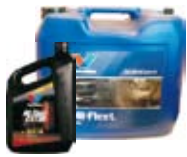
Olja diesel/bensin 15W/40

Valvolines All Fleet Extra passar såväl turbo som kompresor-matade motorer. (Volvo VDS3) 5lit alt 20lit.