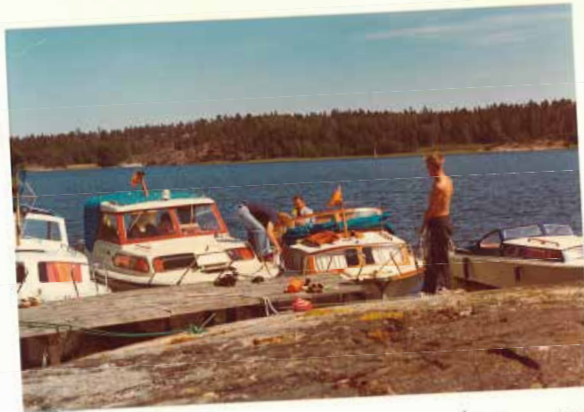
Många båtar vid Klubbholmen som vanligt