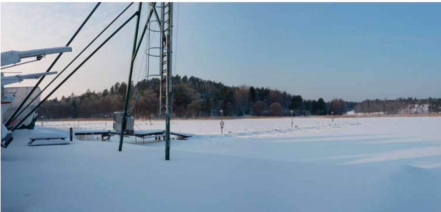
Hamnen innan isen gick den 13 april.