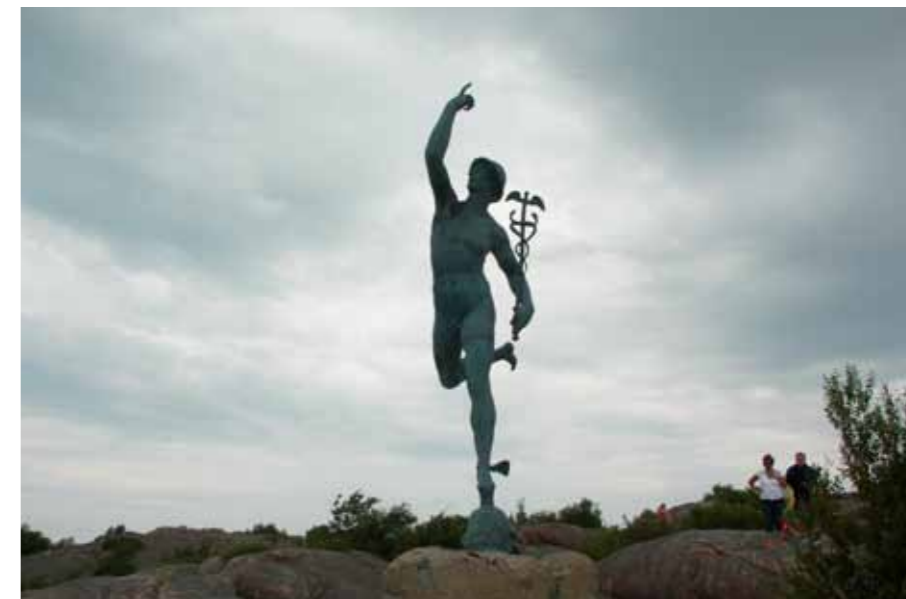
Hermes, Gudarnas budbärare, tronar över hela skapelsen.