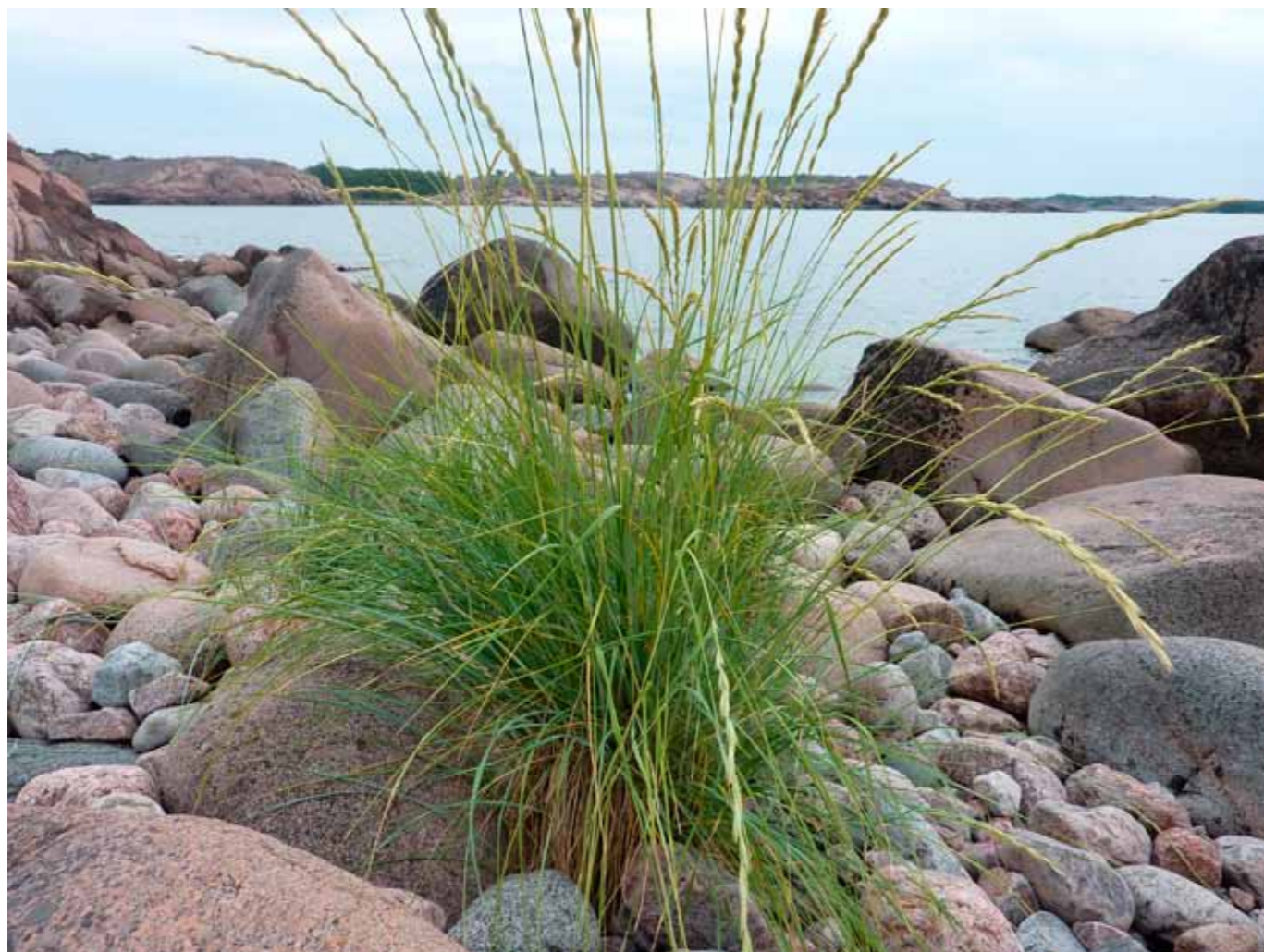
Motiv från Källskär.

Hansa Marin AB, Rolf Gromer, Rörvägen 62, 136 50 Haninge Tel +46 8 550 680 50 mail: info@hansamarin.se