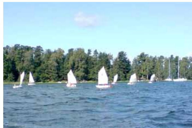
Bild från en seglats utanför Klubbholmen.