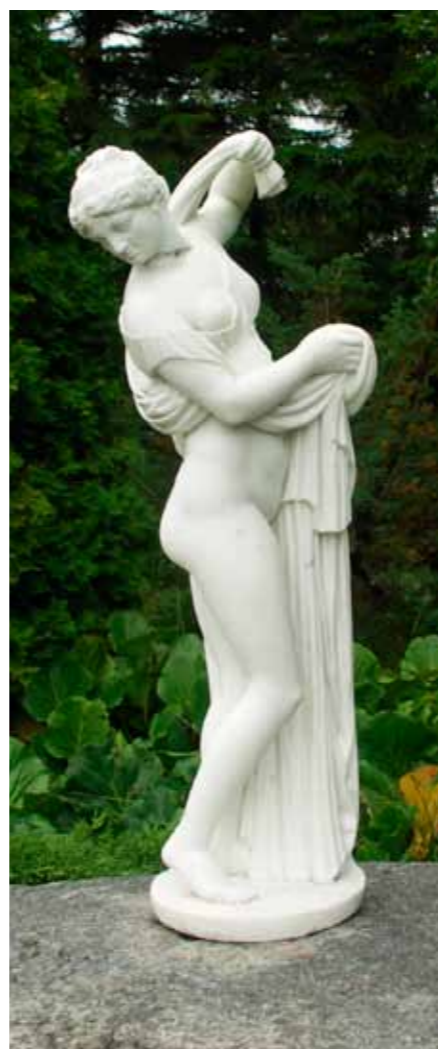
En av många marmorstatyer.

Vår guide, personlig vän med "Grevén". Över spisen syns del av Tove Janssons tavla.