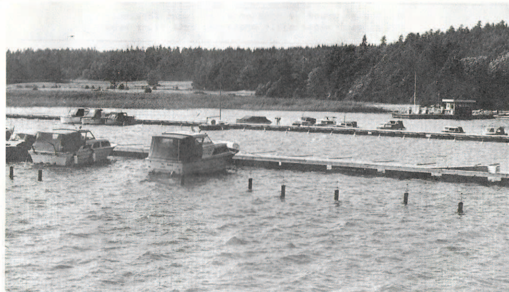
Överblick av marinen. I förgrunden syns de nya åretruntbåtarna.