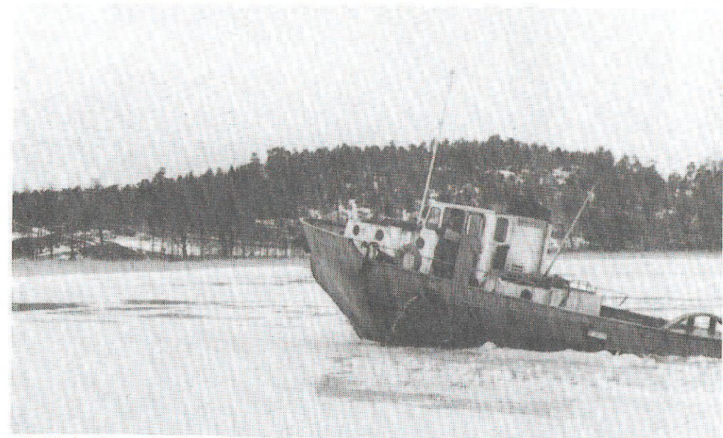
Isbrytning i Askviken