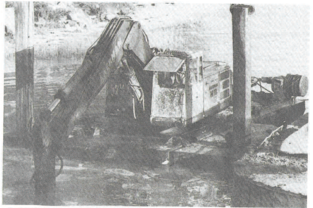
Muddring av sundet