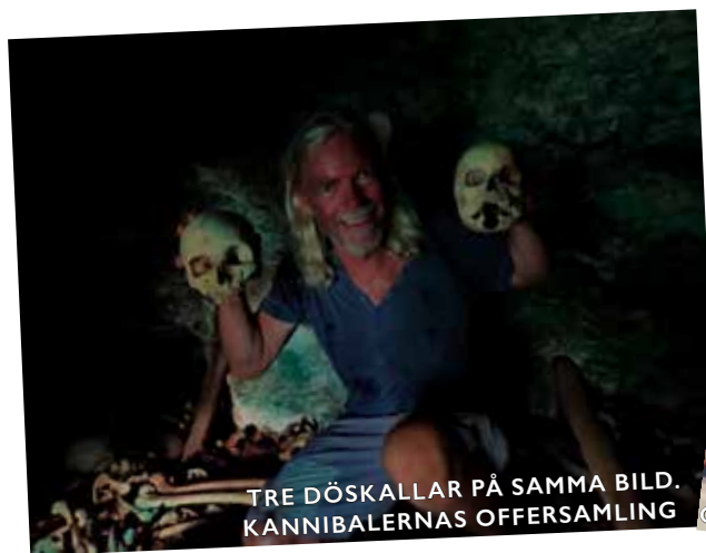
TRE DÖSKALLAR PÅ SAMMA BILD. KANNIBALERNAS OFFERSAMLING