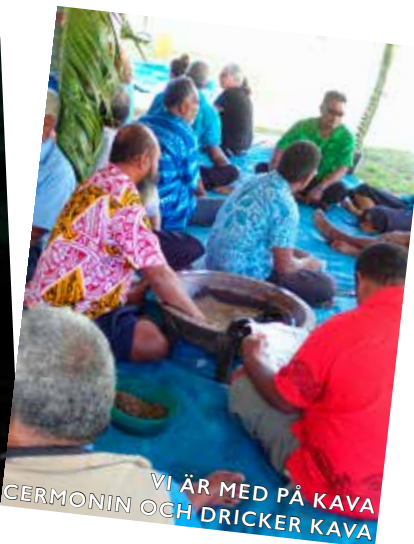
VI ÄR MED PÅ KAVA CERMONIN OCH DRICKER KAVA