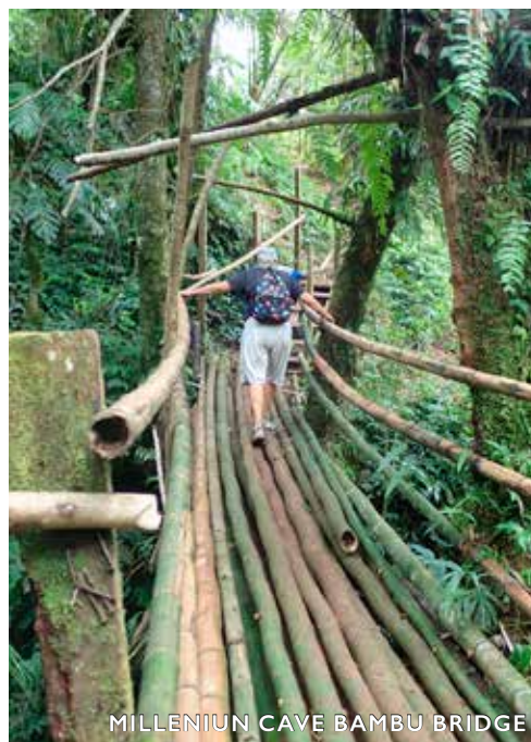
MILLENIUM CAVE BAMBU BRIDGE

Dagen därpå åkte vi på en ännu sämre väg till världens största Banjo träd. Man förstår var filmmakarna som gjorde filmen Avatrar fick sin ide till ett liv i träd.