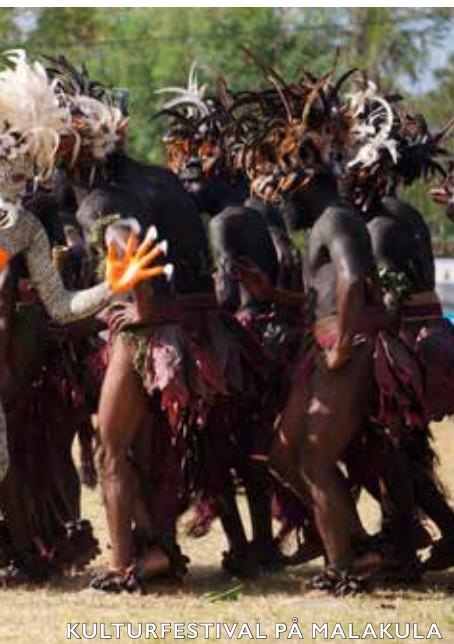
KULTURFESTIVAL PÅ MALAKULA