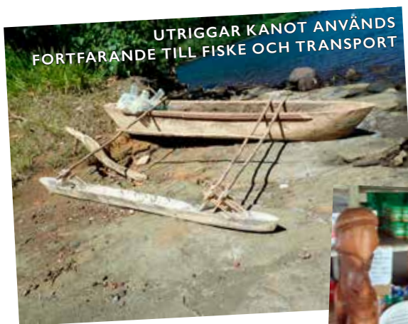
UTRIGGAR KANOT ANVÄNDS FORTFARANDE TILL FISKE OCH TRANSPORT