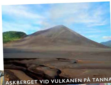
ASKBERGET VID VULKANEN PÅ TANNA