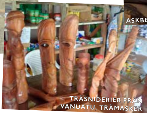
TRÄSNIDERIER FRÅN VANUATU, TRÄMASKER