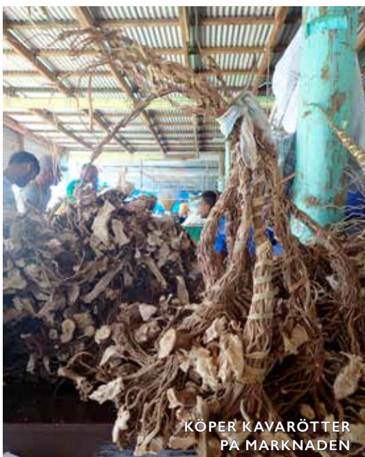
KÖPER KAVARÖTTER PÅ MARKNADEN

Det tog ett tag innan vi hittade ett "vindfönster", alltså ett fönster i tiden då väder och vindar är rätt. Då det infann sig, seglade vi vidare till Suva (som ligger på östra delen av huvudön) där vi lämnade in livflottarna, fick tvätten tvättad, besökte museum och gjorde lite shopping. Sedan drog vi vidare väster ut till samhällena Denareu och Vunda på samma ö. Vi gick igenom det s.k. "passet" på natten och följde ledfyren, för att slutligen ankra nedanför den. På morgonkvisten fortsatte vi till Mamanuca islands och Musket cove.