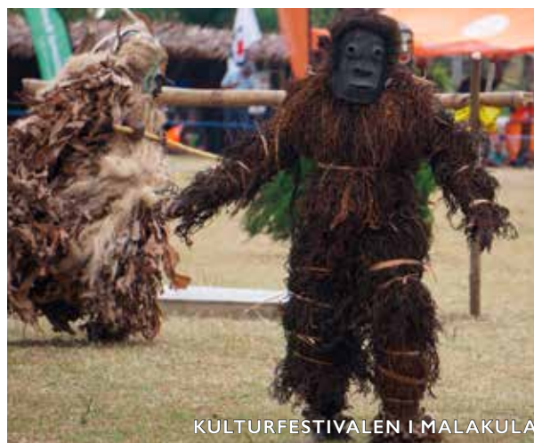
KULTURFESTIVALEN I MALAKULA