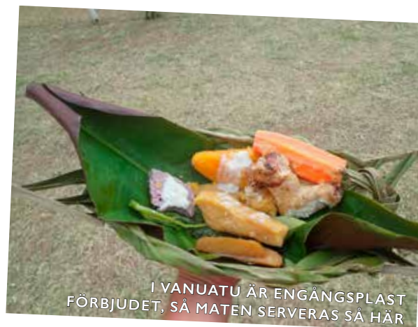
I VANUATU ÄR ENGÅNGSPLAST FÖRBJUDET, SÅ MATEN SERVERAS SÅ HÄR