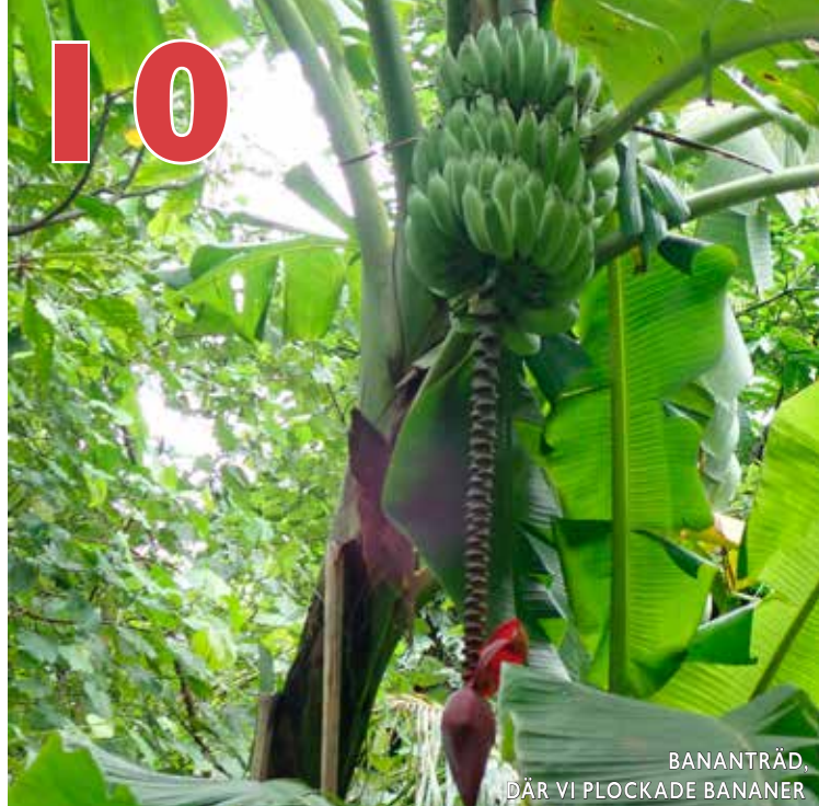
BANANTRÄD, DÄR VI PLOCKADE BANANER