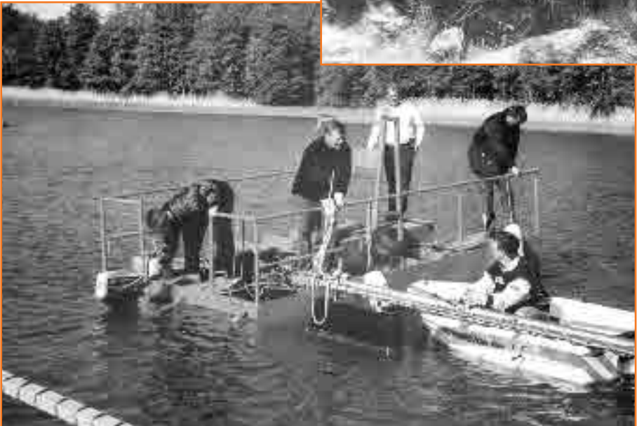
Fyren slet sig under våren och folk jobbade på för att förtöja den på nytt.