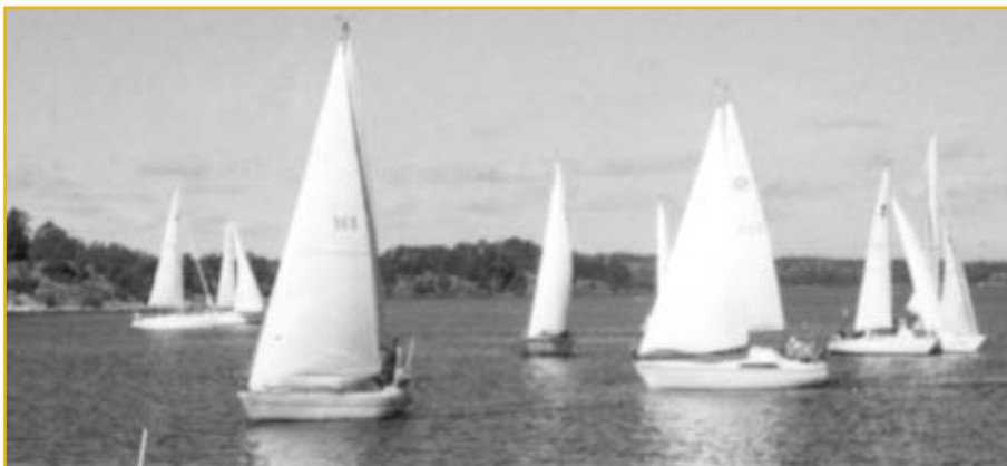
Starten på Kräftköret 2001.

Startnummer 5, Soleado, vann utlottningen av dagens bonuspris.