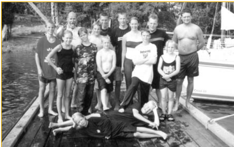
Deltagarna på seglarlägret sommaren 2001.