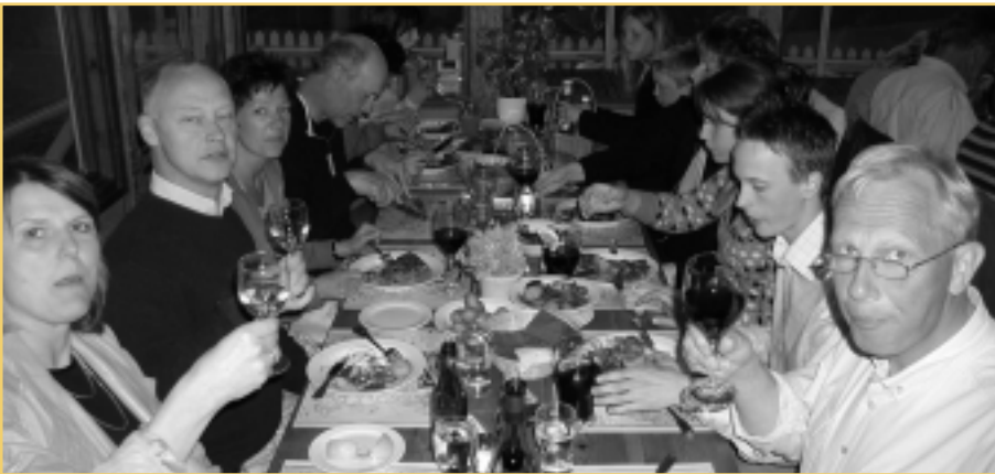
Middag på Fyren...