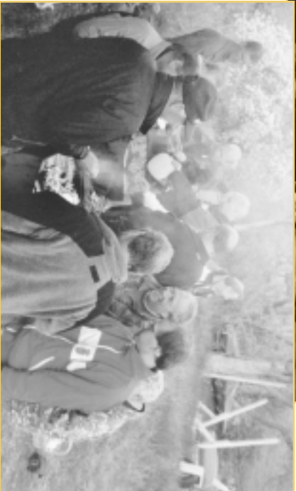
Efter prisutdelningen tändes grillarna, och festen kunde börja.