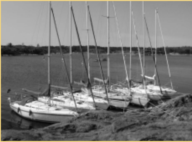
Angöring vid Låskär.