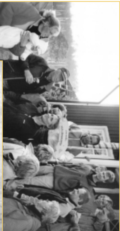
Årets segrare i Bryggkampen blev Pricken!