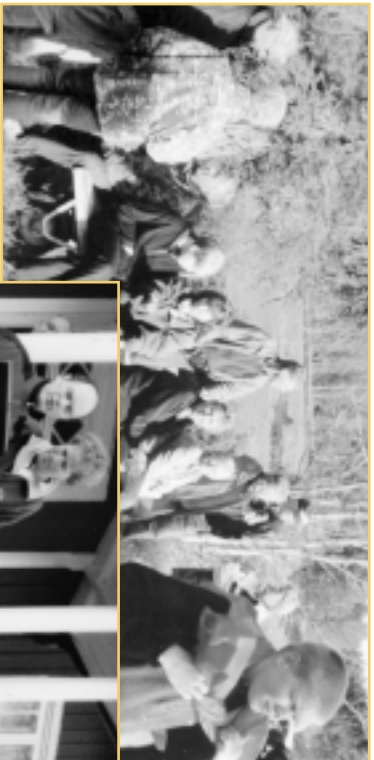
Solen tittade fram lagom till prisutdelningen!