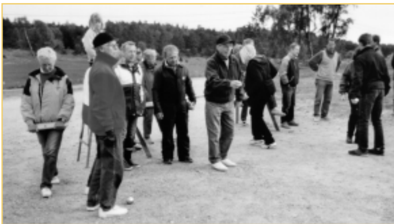
"Det var många som deltog i de olika grenarna - här bouleturneringen."