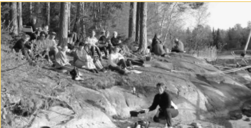
...och middag på Rånö