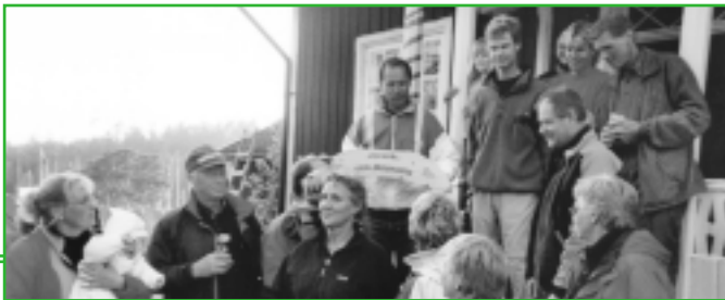
Här ser ni förra årets vinnare av Bryggkampen

Tävlingskommittén, Festkommittén, Redaktionskommittén, Ungdomssektionen.