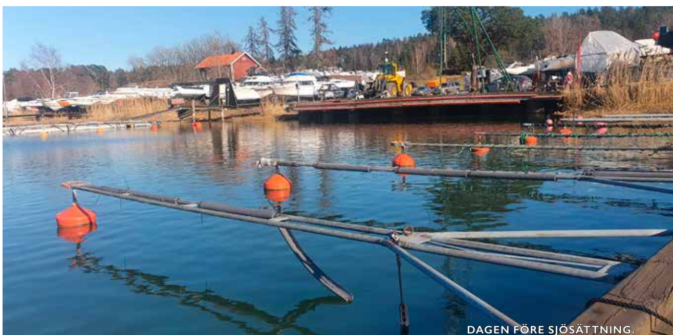
DAGEN FÖRE SJÖSÄTTNING.