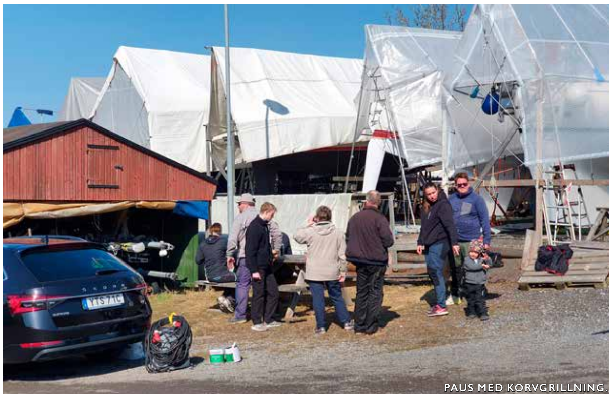
PAUS MED KORVGRILLNING.