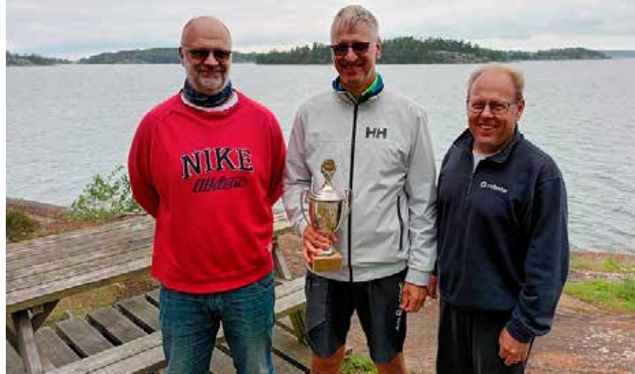
GOODWILL – SEGRARE KRÄFTSEGLINGEN 2023 FOTO: JONAS EDWINSON

Kräftseglingen 23/8. Vi var 9 båtar som kom till start. Vädret var mulet men varmt och skönt och regnet som den här sommaren aldrig varit långt borta, höll sig på avstånd hela dagen. Vid prisutdelningen bjöds det på dricka och snacks.