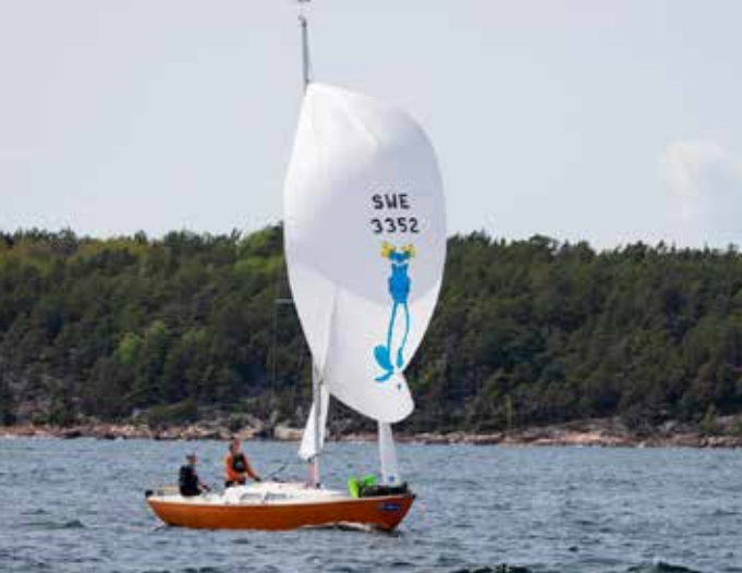
APELSINEN – ORNÖ RUNT 2023