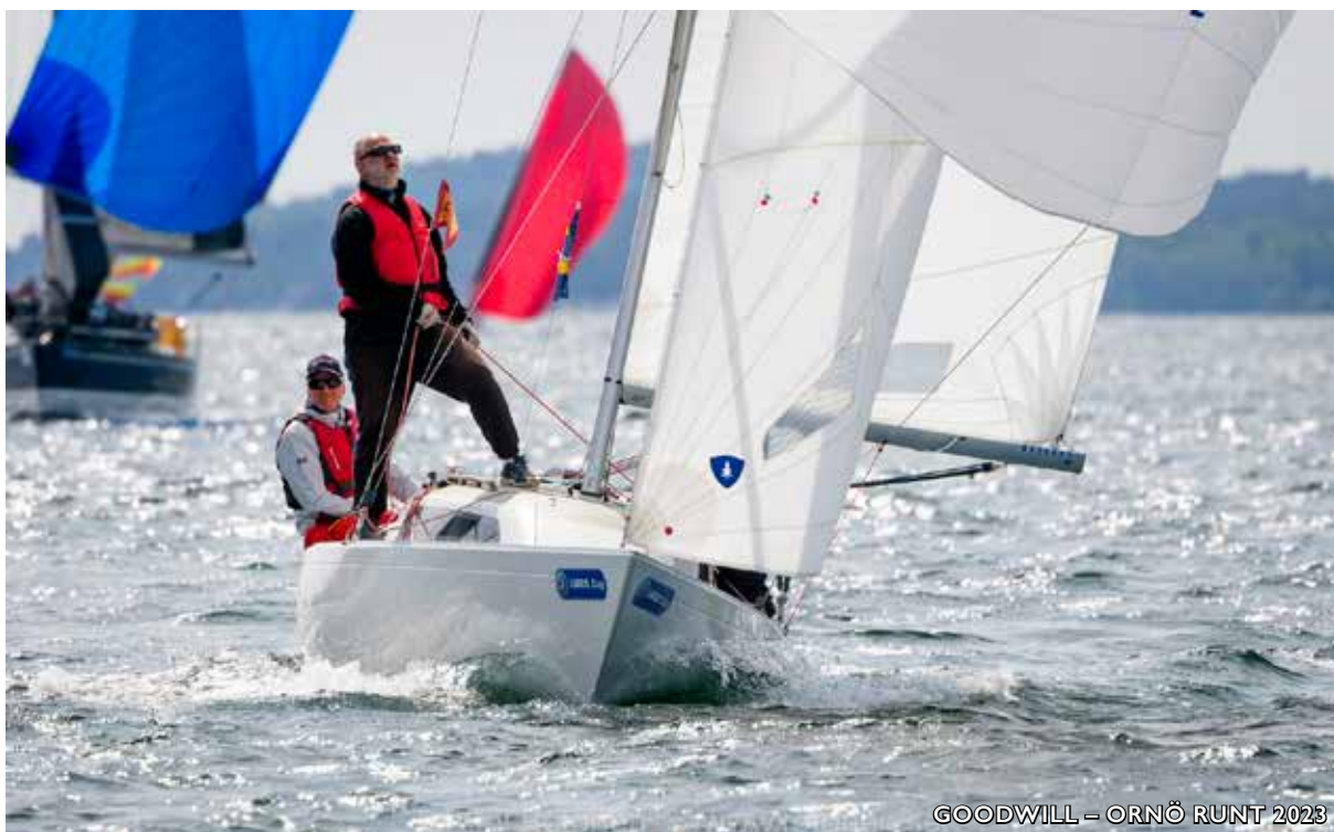
GOODWILL – ORNÖ RUNT 2023

Skoja Cup ställdes in p.g.a. för få deltagare. Lite trist, men det är många konkurrerande seglingar på våren. Vi får planera lite bättre och ta nya tag nästa år.