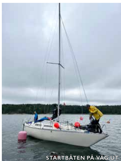
STARTBÅTEN PÅ VÄG UT